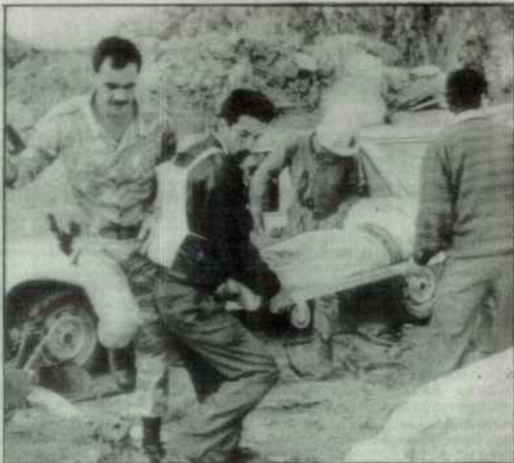
Equipos de rescate retiran el cadáver de René Moawad.